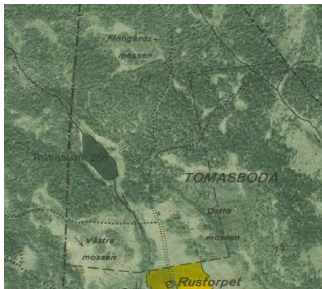
Finngårds mossen, Rusasjön och Rustorpet vid Tomasboda