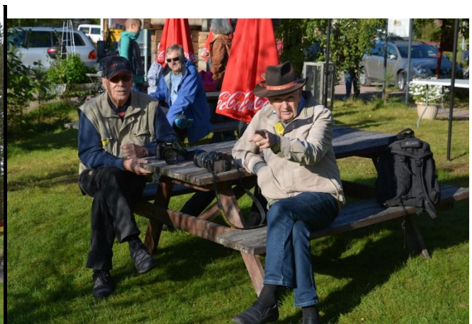
Några utpekade deltagare